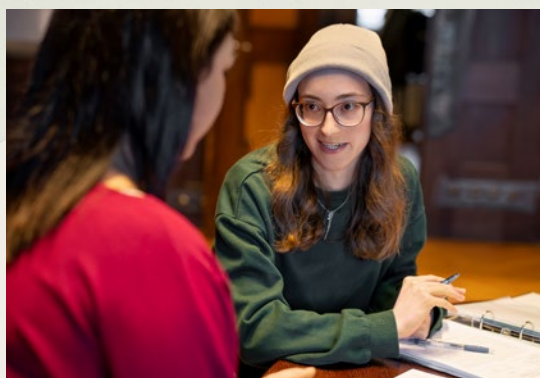
Die Vorbereitung auf die Filmproduktion erfolgt auf behutsame Weise durch erfahrene Psychoonkologinnen anhand eines Drehleitfadens.