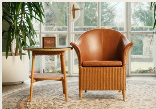
Unser Setting im Wintergarten der Villa: Hier realisieren wir innerhalb eines Tages einen interviewbasierten persönlichen Film.