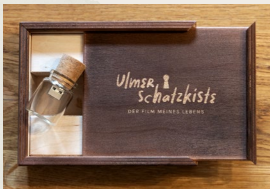
Der fertige Film hat eine Länge von etwa 90 Minuten und wird auf einem USB-Stick gespeichert.