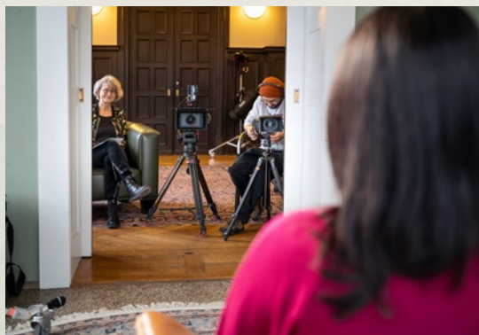
Gefilmt wird mit psychoonkologischer Begleitung und zwei Kameras – auch die professionelle Nachbearbeitung übernehmen wir vollständig.