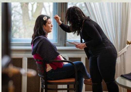
Auf Wunsch kann vor dem Dreh ein verwöhnendes Styling erfolgen.