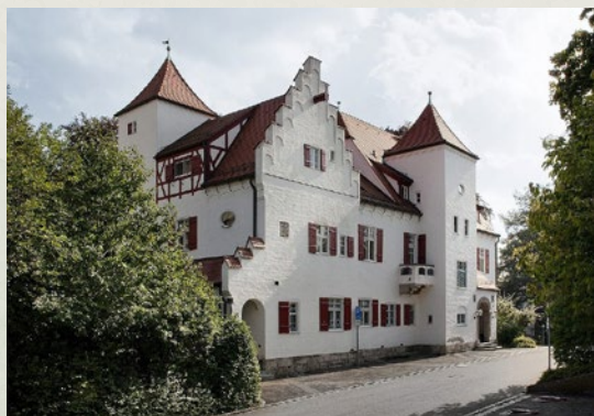
Unsere Filmaufnahmen entstehen in der altherwürdigen Villa Eberhardt der Universität Ulm.

Insbesondere kleine Kinder verstorbener Eltern sind oft nicht in der Lage sich aus eigener Kraft an ihre Eltern zu erinnern. Doch auch bei älteren Kindern dient der Film als Hilfsquelle, um die Erinnerung an die Eltern lebendig zu bewahren . Durch das audiovisuelle Medium Film, können sie ihre Eltern lachen hören – ihren Charakter, ihre Stimme, ihre Mimik und ihre Gestik erfahren. Auch für die Teilnehmerinnen und Teilnehmer selbst ist der Film eine Möglichkeit sich mit dem eigenen Lebensende auseinanderzusetzen . Professionell begleitet können sie sich im Rahmen des Films ihrer eigenen Werte und Bedürfnisse bewusst werden.