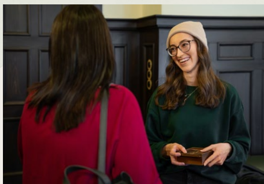
Die Übergabe erfolgt persönlich in einer handgefertigten Holzschatzkiste.