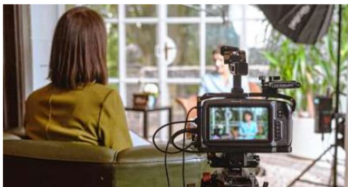
Eine Szene aus einem Videorehder „Ulmer Schatzkiste“. Dank Spenden können sich krebserkrankte Eltern würdevoll von ihren Kindern verabschieden.

In der Regel werden vier Sitzungen benötigt, um mit der schwer erkrankten Person ins Gespräch zu kommen, Vertrauen aufzubauen, zu unterstützen, sich der eigenen Werte klar zu werden, um den eigenen Abschied vom Leben würdevoll zu gestalten. Die multimediale, meist 60- bis 90-minütige Doku-